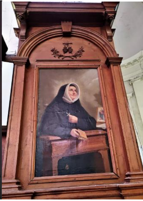
Sainte Madeleine Barat