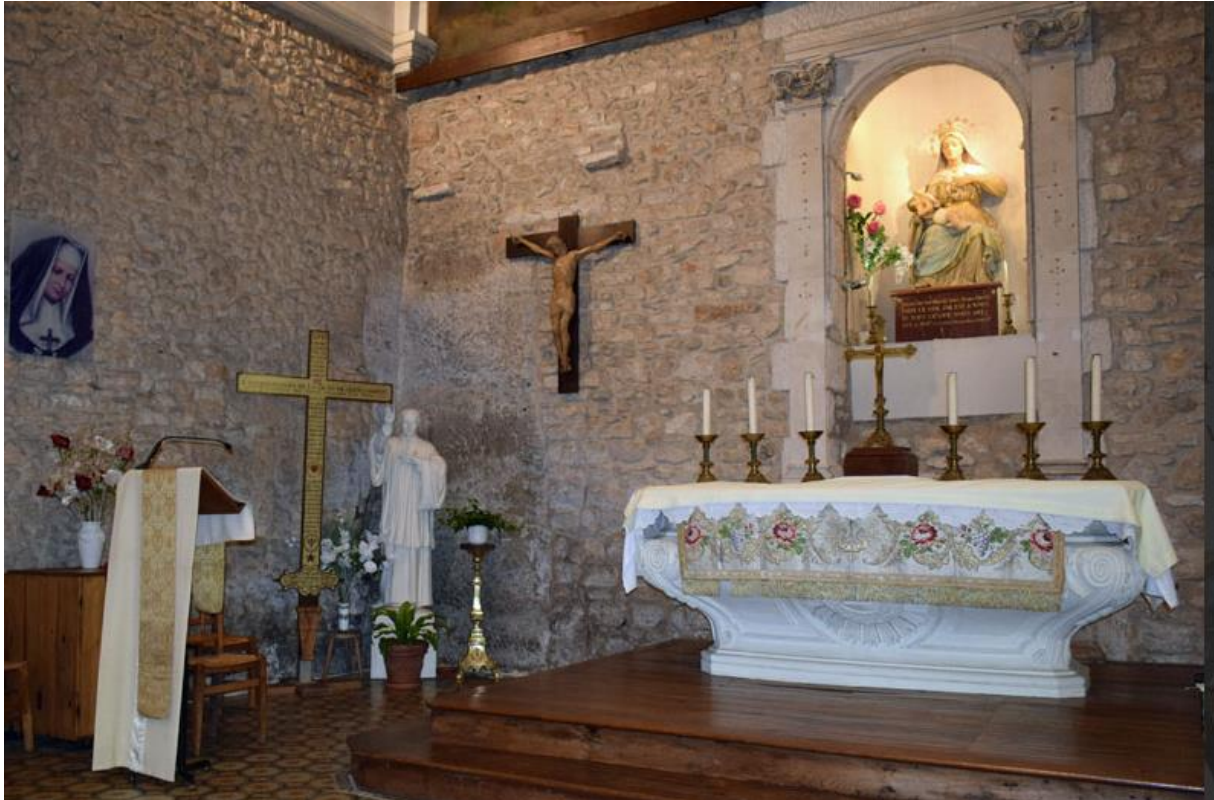
Chapelle N.D. des cœurs

Cette journée s'est terminée au cimetière de Notre-Dame des Champs. Les sœurs du Sacré-Cœur y ont leur « carré ». Parmi les tombes se trouve celle de Sœur Josefa Menéndez : c'est la tombe la plus visitée et la plus fleurie de tous les cimetières de Poitiers.