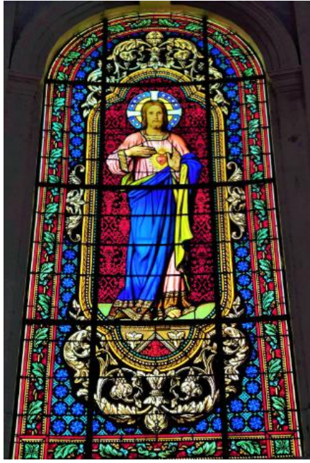
Vitrail du Sacré-Cœur